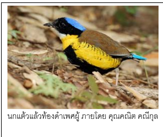
นกแก้วแล้วท้องดำเพศผู้ ภายโดย คุณณคณิต คณีกุล

ต่อมา ผมขอเล่าเกี่ยวกับประวัติศาสตร์และความความ