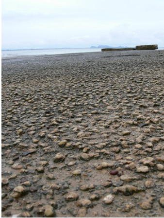
อุทยานหอย 75 ล้านปี