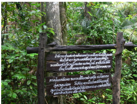
ป้ายบอกเรื่องราวของเขานอจู้จี้ ป่าที่ราบต่ำผืนสุดท้ายของภาคใต้

ส่วนงานพืชสวนโลกที่จะเปิดวันที่ 1 พฤศจิกายน 2549 ที่จังหวัดเชียงใหม่ ได้มีแผนงานหนึ่งที่จะให้ดอกคูณหรือราชพฤกษ์บานสะพรั่งในงาน แต่ในความเป็นจริงแล้วเป็นไปได้ เพราะในช่วงเดือนพฤศจิกายนดอกคูณยังไม่ออกดอก ดอกคูณจะออกดอกในช่วงต้นเดือนเมษายน-เดือนพฤษภาคม หรือในช่วงฤดูแล้ง สุดท้ายก็ต้องเลิกปลูกราชพฤกษ์ ผมเคยถามผู้จัดในช่วงแรกๆ คนจัดบอกว่าขอใช้ดอกไม้พลาสติกได้ไหมครับ ถ้าเป็นเช่นนั้นงานพืชสวนโลกคงจะเป็นงานที่ตั้งใจไปทั่วโลก เพราะใช้ดอกไม้พลาสติก เรื่องเหล่านี้จึงเป็นบทเรียนให้ผู้บริหารได้เป็นอย่างดี