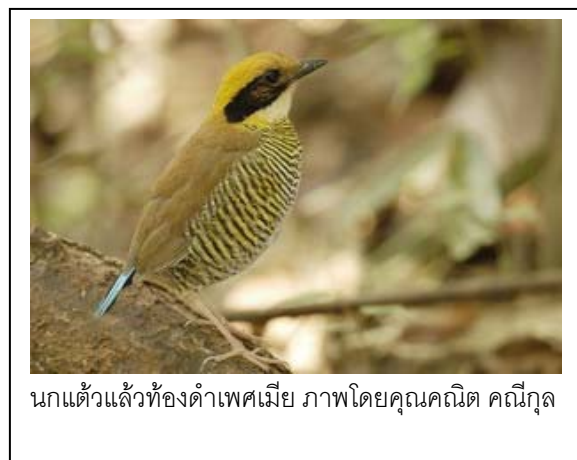
นกแก้วแล้วท้องดำเพศเมีย

หลากหลายทางชีวภาพของจังหวัดกระบี่ เริ่มต้นที่สนามบินกระบี่ ที่แต่ก่อนไม่ใหญ่โตมโหฬารเหมือนในปัจจุบัน หรือไม่มีสนามบินด้วยซ้ำไป หากต้องการมาที่จังหวัดกระบี่ ต้องไปลงเครื่องบินที่จังหวัดภูเก็ตหรือจังหวัดตรัง