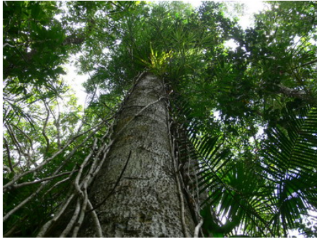
ไม้ยืนต้นสูงในเขตรักษาพันธุ์สัตว์ป่าเขาประ-บางคราม หรือเขานอจู้จี้

มีมาก ราชพฤกษ์หรือคูณมักจะมีหนอนและเกิดโรคมากมาย จึงไม่ควรนำมาปลูกไว้ตามบ้านเรือนหรือสถานที่ราชการ ผมเสนอทางเลือกว่า ถ้าต้องการปลูกไม้ดอกสีเหลือง ในบ้านเรายังมีอีกหลายชนิดที่น่าสนใจ เช่น ประดู่ป่า ประดู่บ้าน นนทรี ทรงบาดาล และชี่เหล็กไทย เป็นต้น นำมาปลูกสลับกันไปให้มีความหลากหลายของชนิดพันธุ์แทนที่จะปลูกเพียงชนิดเดียว