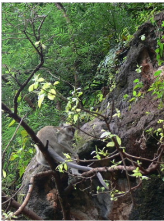
ฝูงลิงแสมหน้าวัดถ้ำเสือ