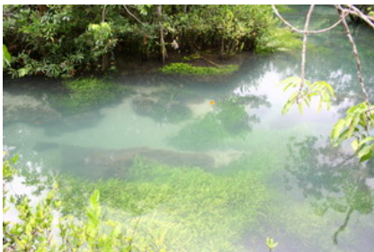
พันธุ์ไม้น้ำพวกคลิปปที่ท่าปอมคลองสองน้ำ