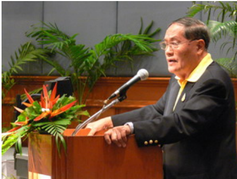
ฯพณฯ อำพล เสนาณรงค์ องคมนตรี