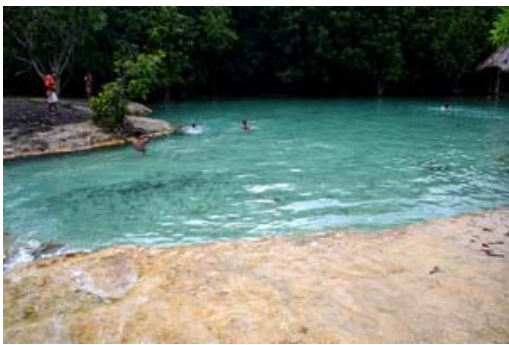
สระมรกต มีผู้มาเยี่ยมชมมากในวันหยุด

รอบแผ่นดินเสมอบนเขานอจู้แต่ก่อนเป็นป่า แต่เดี๋ยวนี้กลายเป็นสวนปาล์มน้ำมัน ซึ่งมีการปลูกมาประมาณ 4-6 ปี และก็เกิดปัญหาขึ้นมาก พระราชินีของกษัตริย์จอร์แดน ซึ่งเป็นนายกสมาคมนกโลก ท่านมีพระราชเสาวนีย์ถึงในหลวงว่าให้ช่วยดูแลตรงพื้นที่ตรงนี้ ซึ่งในหลวงท่านได้ทรงมอบหมายให้ผมมาดูแล หลังจากนั้นมีการระดมเจ้าหน้าที่ป่าไม้มาจัดการพื้นที่ให้เรียบร้อย ทำให้รักษาพื้นที่ป่าไว้ได้นิดหน่อย เพราะพื้นที่ป่าส่วนใหญ่หมดแล้ว รอบ ๆ ก็มีถนน พื้นที่บนนั้นยังมีคนอยู่ และมีนกแล้วแล้วอยู่บนที่ราบ ซึ่งถือว่าเป็นเขตที่ราบต่ำภาคใต้แห่งเดียวที่ยังเหลืออยู่ โดยมากจะมีฝรั่งที่สนใจไปนั่งส่องกล้องดูนกแล้วท่องดำซึ่งเจ้าหน้าที่ยืนยันว่ามี 20 คู่ แต่ก่อนมี 16 คู่ ซึ่งก็ถือว่าเป็นเพิ่มขึ้นมา ที่หน่วยฯ จะมีนกแล้วแล้วออกเที่ยวเพิ่มด้วยอยู่ 2 ตัว ซึ่งกำลังอยู่ในระหว่างการศึกษาวิจัยจากนักวิชาการป่าไม้ ผมตื่นตั้งแต่ 6 โมงเช้า ฝ้ามองพฤติกรรมต่าง ๆ นักท่องเที่ยวส่วนใหญ่จะไปเที่ยวเขานอจู้ โดยมากก็จะไปดูนกแล้วแล้วท่องดำ ไปดูป่าดิบน้ำทะเลแห่งเดียวของประเทศไทย ไปเที่ยวแผ่นดินเสมอ และสระมรกตซึ่งมีน้ำออกมาสีเขียว ซึ่งหากไปช่วงวันหยุดเสาร์-อาทิตย์ จะพบคนไทยมากถึง 100-200 คน