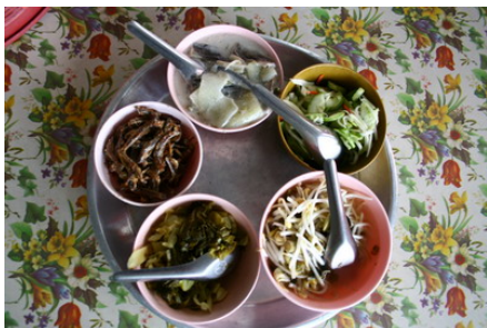
ความหลากหลายทางอาหารที่กระบี่

เช่นเดียวกับสมองมนุษย์ หากรับมากเกินไปจะเกิน หน่วยความจำเหมือนกัน ตอนนี้อายุ 75 ปีแล้ว พอมีเรื่อง ใหม่เข้ามา ผมก็รับไว้ได้ แต่อาจลืมเรื่องเก่าได้ เพราะฉะนั้น ตอนนี้ผมปฏิบัติตัวแบบกล้องดิจิทัล คือ บางเรื่องผมไม่สนใจ ไม่ฟัง ไม่รับรู้ บางเรื่องก็ลบบอก ไม่ต้องไปจำ เพื่อจะได้เก็บ ข้อมูลใหม่ๆ ที่เราสนใจ ซึ่งจะจำได้มากน้อยแค่ไหนขึ้นอยู่กับ ระดับของความสนใจ