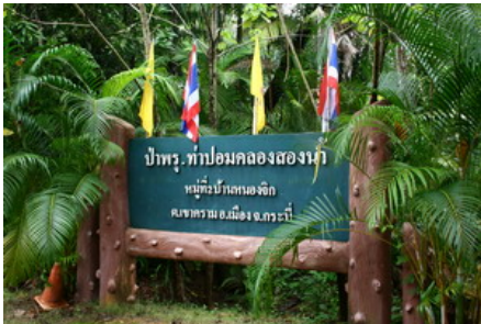
ท่าปอมคลองสองน้ำ บริเวณที่น้ำจืดและ น้ำเค็มมาบรรจบกัน

แล้วค่อยต่อรถมาที่นี้ แต่ตอนนี้คนที่จะไปจังหวัดตรังกลับต้องมาลงที่กระบี่ก่อน แล้วค่อยต่อรถไปจังหวัดตรัง โลกเปลี่ยนไปเพราะความสำคัญของการท่องเที่ยวอยู่ที่จังหวัดกระบี่ ทำให้มีนักท่องเที่ยวมากขึ้น อดีต นายกรัฐมนตรีนายอานันท์ ปันยารชุน ท่านไม่เคยมาจังหวัดกระบี่ พอมาเห็นก็บอกว่าจังหวัดกระบี่มีสิทธิ์ที่จะ เป็นเมืองท่องเที่ยวที่สำคัญ เพราะมีสิ่งที่น่าสนใจหลายอย่าง เช่น ทะเลหน้าเมือง ซึ่งเป็นทะเลที่สะอาด เรียบร้อย ผมทราบมาว่าผู้ว่าราชการจังหวัดกระบี่คนปัจจุบันท่านกวัดข้นเรื่องการท่องเที่ยวมาก เพราะอยากให้ มีการท่องเที่ยวแบบเรียบง่าย