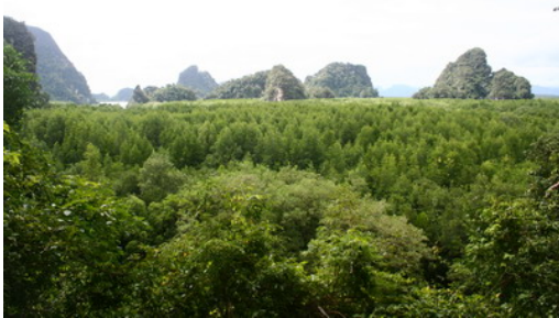
ภูเขาหินปูนและป่าชายเลนที่สื่อถึง จ.กระบี่