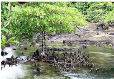
รากไม้ชายเลนรูปร่างแปลกตาที่ท่าปอม คลองสองน้ำ

เมือง คือ วัดถ้ำเสือ ซึ่งมีต้นไม้อายุพันปีและในวันนี้พระบรมสารีริกธาตุที่อันเชิญมาจากประเทศศรีลังกาก็จะ ถูกนำไปประดิษฐานไว้ที่วัดแห่งนี้ ในบริเวณวัดมีลักษณะเป็นเหมือนหุบเขาสูงขึ้นไปประมาณ 80-90 เมตร มี