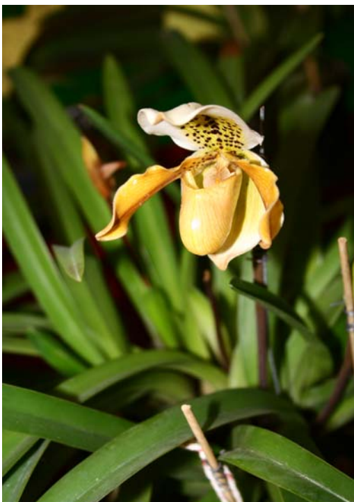
รองเท้านารีเหลืองกระบี่

ขึ้นไปทางด้านจังหวัดพังงาจะมีจุดที่น่าท่องเที่ยว คือ ท่าปอมคลองสองน้ำ ซึ่งห่างจากตัวเมืองกระบี่ประมาณ 20 กิโลเมตร ที่นั่นจะมีน้ำจืดจากภูเขาและน้ำทะเลไหลมาพบกัน แต่จะไม่ไหลรวมกัน จึงเห็นน้ำจากภูเขาสีใสและเย็น ส่วนน้ำทะเลสีคือน้ำขุ่นและอุ่น ไหลมาพบกันโดยไม่รวมกันจนออกไปถึงทะเล และจะเห็นพีชสองกลุ่มอยู่ด้วยกัน ด้านหนึ่งเป็นพีชน้ำจืดจะอยู่ทางด้านน้ำเย็นที่ไหลจากภูเขา อีกด้านหนึ่งจะเป็นพีชทะเล ทำให้