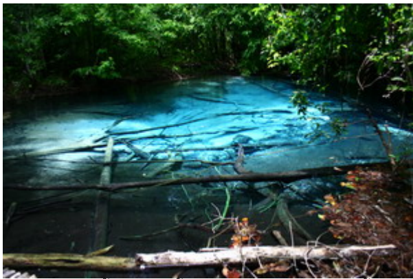
สระน้ำมุด แอ่งน้ำสีฟ้าใสสะอาด ที่เขานอจู้จี้

เขานอจู้จี้หรือเขตรักษาพันธุ์สัตว์ป่าเขาประ-บางคราม เป็นสถานที่ท่องเที่ยวทางธรรมชาติที่น่าสนใจ และเกี่ยวข้องกับตรงๆกับผม เพราะอยู่ในโครงการพระราชดำริฯ ท่านคงเคยได้ยินชื่อนักแล้ว ที่นั่นถือว่าเป็น แหล่งสุดท้ายของโลกที่ยังมีนกแก้วแล้วท่องดำ ผมไปเมื่อสองสัปดาห์ที่แล้ว เขาบอกว่ายังมีอยู่ 20 คู่ คนที่ไปดู นกแก้วแล้วได้ ต้องมีความอดทนเฝ้าดูตั้งแต่เช้าจนเย็น ระวังนกแก้วแล้วจะสูงประมาณ 1 เมตร อาศัยตามต้นระกำ และต้นไม้อื่นๆ ต้องไปนั่งเฝ้าส่องกล้อง คนที่ใจร้อนจะไม่ได้ดู ไม่ได้เห็น พื้นที่แถบนั้นเป็นตัวอย่างของการถูก บุกรุกโดยพืชเศรษฐกิจที่บุกรุกพืชป่าและความหลากหลายทางชีวภาพ แต่ก่อนแถบนี้เป็นป่าทั้งหมด แต่พอพืช เศรษฐกิจขยายตัว เช่น ปาล์มน้ำมัน ผู้คนก็มาถางและจับจองพื้นที่เพื่อปลูกพืชเศรษฐกิจมากขึ้น โดยเฉพาะช่วง สมัยสงครามโลกครั้งที่ 2 หรือสมัยที่มีผู้ก่อการร้าย