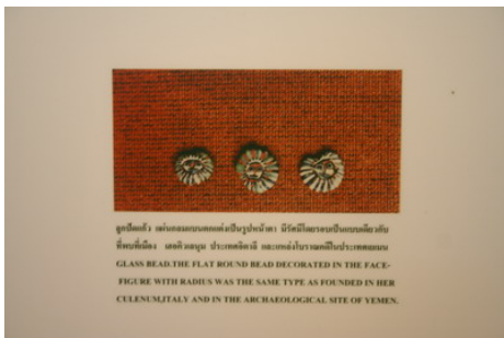
ความหลากหลายทางวัฒนธรรมที่กระบี่