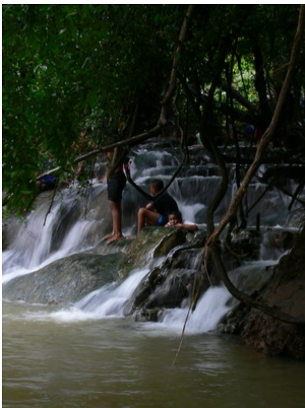
น้ำตกร้อน Unseen in Thailand in Krabi

เขานอจู้จี้ มีลักษณะเป็น “แผ่นดินเสมอ หรือ table land” ผมต้องขอแก้ไขบทความกล่าว เปิดในการประชุมวิชาการประจำปีโครงการ BRT ครั้งที่ 9 ทางฝ่ายเลขานุการ เขียนว่า cable land ที่จริงต้องใช้คำว่า table land ซึ่งแปลว่า โต๊ะ แผ่นดินเสมอ จะมีลักษณะเป็นพื้นสูงขึ้นไป แล้วด้านบนจะลาด เช่น พื้นที่ภูกระดึง หรือ ภู ต่างๆ ทางอีสาน บางแห่งในอเมริกาใต้เขาถือเป็นดินแดนมหัศจรรย์ คนขึ้นไม่ได้ ซึ่งบางทีจินตนาการกันว่าบนนั้นมีไดโนเสาร์ มีสิ่งลึกลับต่างๆ หลงเหลืออยู่ แผ่นดินเสมอบนเขานอจู้จี้มีเนื้อที่หลายพันไร่ สมัยนั้นมีผู้ก่อการร้ายอาศัยอยู่ ภายหลังมีการปลูกพืชต่างๆ ไว้ เช่น ปาล์มน้ำมัน กาแฟ เนื่องจากเราไม่สามารถนำคนที่อาศัยอยู่บนนั้นลงมาได้ จึงต้องอนุญาตให้ปลูกต่อไป ซึ่งคนที่อาศัยอยู่บนนั้นมีประมาณ 200 คน พืชที่ปลูกก็มีหลายพันธุ์ เช่น ต้นปาล์มน้ำมันซึ่งอายุมากแล้ว บนนั้นมีแหล่งน้ำ มีต้นน้ำ ที่ราบสวย แต่ผู้ที่อาศัยอยู่ไม่มีสิทธิ์ในที่ดิน เพราะถือเป็นเขตสงวนพันธุ์ สัตว์ป่า เด็กอนุบาลจะเรียนอยู่บนนั้น พอเด็กโตต้องลงมาเรียนข้างล่าง เพราะไม่มีโรงเรียนทางการ โรงเรียนที่มีก็ไม่ถูกต้องตามกฎหมาย แต่รัฐบาลก็ทำอะไรไม่ได้ซึ่งตอนนี้ยังเป็นปัญหาอยู่