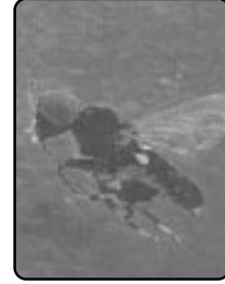
ริ้นดำตัวเต็มวัย Simulium (Simulium) jeffryi

ในประเทศไทยยังไม่มีรายงานการก่อโรคนี้สู่คน แต่พบว่าการก่อความรำคาญให้กับนักท่องเที่ยวและสัตว์เลี้ยงในพื้นที่ภาคเหนือ