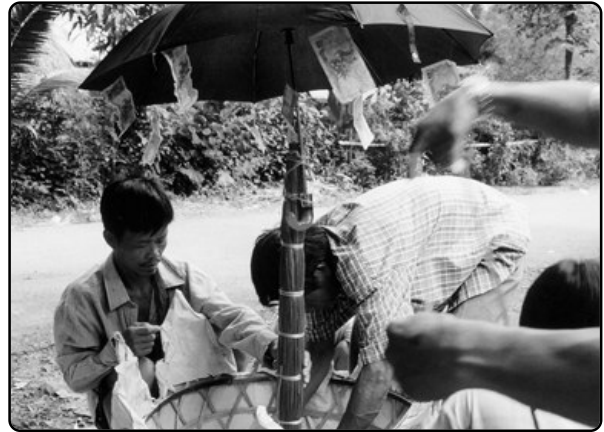
ประเพณีวัฒนธรรมในท้องถิ่น

นิสิตนักศึกษาจากมหาวิทยาลัยต่างๆ ทั่วประเทศทั้งจาก เกษตรศาสตร์ มหิดล ขอนแก่น จุฬาลงกรณ์ เชียงใหม่ มุรพทา และสถาบันราชภัฏ จึงทำให้เราได้มีโอกาสเปิดรับนักวิจัย และนิสิตนักศึกษาจากภายนอกเข้ามาใช้ห้องปฏิบัติการ ธรรมชาติแห่งนี้ได้อย่างเต็มที่