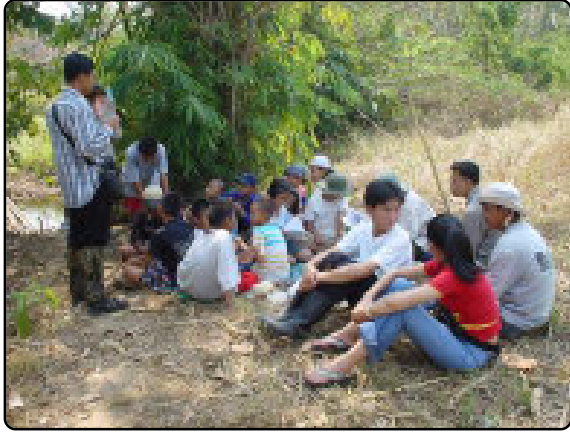
การทำกิจกรรมระหว่างนักวิจัยกับเยาวชนในพื้นที่