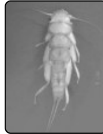
ตัวอ่อนของ stoneflies ตัวอ่อนของ Etrocorema sp.

ริ้นดำ ปิ้ง หรือคูน เป็นแมลงขนาดเล็กอยู่ในอันดับ Diptera พบเฉพาะบริเวณแหล่งน้ำที่มีน้ำไหล ในประเทศไทยพบริ้นดำประมาณ 44 ชนิด ตัวเต็มวัยมักก่อปัญหาด้านการแพทย์และการสาธารณสุข เนื่องจากตัวเมียของริ้นดำบางชนิดกินเลือดคนและสัตว์เลี้ยง และเป็นพาหะของพยาธิปลาเรีย ชนิด Onchocerca volvulus ที่เป็นสาเหตุให้เกิดโรค Onchocerciasis หรือ river blindness ซึ่งทำให้เกิดอาการแพ้หรือบวมตามกล้ามเนื้อและอาจทำให้ตาบอดได้