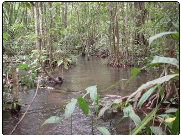
พุนองปลิง

เราได้แบ่งงานวิจัยของสถานีฯ แห่งนี้ออกเป็น 3 กลุ่ม ตามสภาพภูมิศาสตร์และระบบนิเวศ นั่นคือ กลุ่มบก กลุ่มน้ำ และกลุ่มชุมชนท้องถิ่น นอกจากนี้ยังได้กำหนด