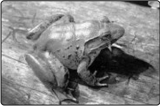
กบทุก หรือกบภูเขา หรือเขียดแลว ( Rana blythii Boulenger, 1920)

กบเป็นสัตว์สะเทินน้ำสะเทินบกที่คนไทยรู้จักกันดี และเป็นอาหารที่นิยมบริโภคกันมาช้านาน เพราะเนื้อกบมีโปรตีนสูง กบที่จำหน่ายส่วนใหญ่ได้จากการจับตามธรรมชาติ ซึ่งนับวันก็จะยิ่งลดน้อยลงเรื่อยๆ โดยเฉพาะกบที่หายากและใกล้สูญพันธุ์อย่างกบทุก หรือกบภูเขา หรือเขียดแลว ( Rana blythii Boulenger, 1920) ซึ่งชอบอาศัยอยู่ริมลำธารน้ำตก ตามแอ่งหิน โขดหิน ในป่าที่อุดมสมบูรณ์โดยเฉพาะตามแนวเทือกเขาทางภาคเหนือแถบจังหวัดแม่ฮ่องสอนเรื่อยมาทางแนวขุนเขาตะวันตกบริเวณจังหวัดกาญจนบุรี และลงไปจนถึงอำเภอเบตง จ.ยะลา ทางภาคใต้ของประเทศไทย วิธีสังเกต กบทุกตัวง่าย ๆ ก็คือ กบทุกตัวจะมีขนาดโตกว่ากบทั่วไป กล่าวคือ มีความสูง (ขณะนั่ง) ประมาณ ๖ - ๘ นิ้ว เฉพาะขาหลังยาวประมาณ ๖ นิ้ว ลำตัวอ้วน หัวมีลักษณะรูปไข่ปลายจุกค่อนข้างแหลมเมื่อเทียบกับกบชนิดอื่น เห็นแผ่นหูชัดเจนอยู่ทางด้านหลังของตา ผิวหนังบางและเรียบบวกกับทั่วไปมีสีดำหรือสีน้ำตาลเข้มตลอดลำตัวไม่มีลายจุด